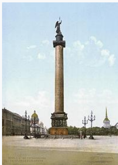
Цветная фотолитография XIX века

Панорама Дворцовой площади со стороны Мойки