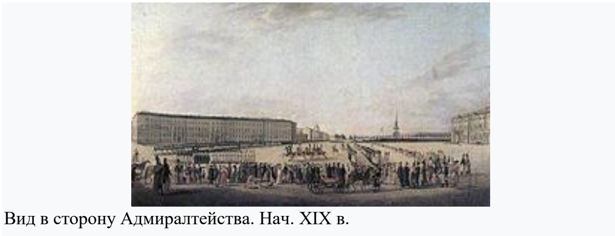
Вид в сторону Адмиралтейства. Нач. XIX в.

формы. Проект площади получил замкнутый, обособленный характер. Колоннада не была увязана с планировкой примыкающих частей города. Однако центральная ось площади (север — юг), определённая зодчим, прошедшая через главные ворота дворца, выведенная в Большую Луговую, сохранена во всех последующих проектах и окончательно закреплена К. Росси .