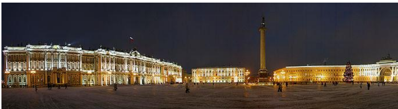
Дворцовая площадь ночью

Дворцовая площадь представляет единый архитектурный ансамбль. Северной границей является фасад Зимнего дворца , южная граница имеет полуциркульное очертание, образованное зданием Главного штаба , два трёхэтажных корпуса которого соединены триумфальной аркой, увенчанной колесницей победы. В центре установлена Александровская колонна . С восточной стороны площадь обрамляет здание Штаба гвардейского корпуса.