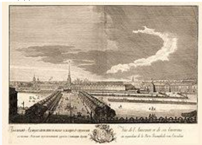
Проспект Адмиралтейства. 1753 г.