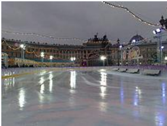
Каток на Дворцовой

В ноябре 2007 года на Дворцовой площади был сооружён платный каток с искусственным льдом . Каток сразу же привлёк к себе внимание многочисленных общественных организаций города, которые протестовали против строительства катка, ограничивающего доступ к части Дворцовой площади и подход к Александровской колонне, доступ к которым должен быть свободным. [40] Каток был закрыт в марте 2008 года .